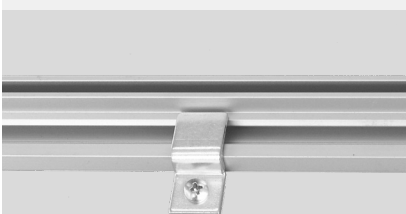
Wandhaken/ wall hooks