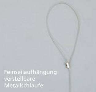
Feinseilaufhängung verstellbare Metallschleufe