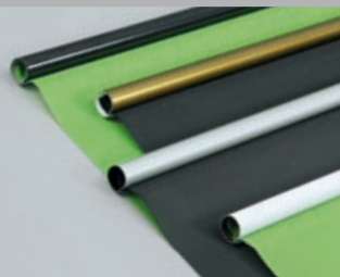
mögliche Farben: gold, silber, schwarz und weiß

*auch in schwer entflammbarer Ausführung erhältlich