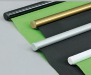
mögliche Farben: · gold mit farblich passenden Endkappen · silber mit silbernen Endkappen · schwarz mit schwarzen Endkappen · weiß mit weißen Endkappen

*auch in schwer entflammbarer Ausführung erhältlich