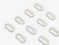
Depothaken, 10er-Set als Zubehör optional erhältlich

Alle Maße sind circa Angaben. Da wir ständig an der Weiterentwicklung unserer Produkte arbeiten, müssen wir uns technische Änderungen sowie Toleranzen vorbehalten.