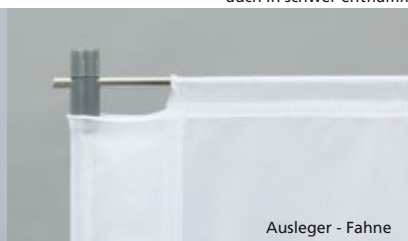
Ausleger - Fahne